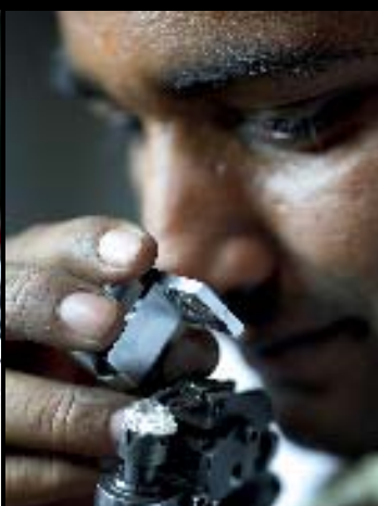
Bis zu 800-mal am Tag prüft ein Schleifer den Stein während der Verarbeitung von Auge.