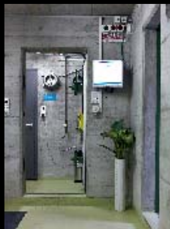
Die Manufaktur ist ein Hochsicherheitstrakt in einer früheren Zivilschutzanlage.

Was sich hinter der Fassade der Zivilschutzanlage verbirgt, weiss im Dorf kaum jemand. Eine Nachbarin, die sich gewundert hatte, konnte Koller beruhigen – sie hatte hinter den dicken Mauern eine Wafenschmiede vermutet. ■